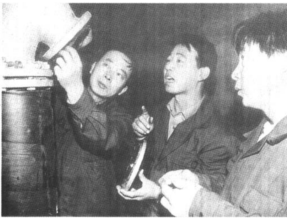
胜利油田重点技改项目，孤岛社区美籍地热站近日投入运行。该地热井水温高达摄氏82度，将高温水回收后再加热软化水为美籍小区7万平方米的住户供暖，既节能又环保。图为工人在检查地热井管。