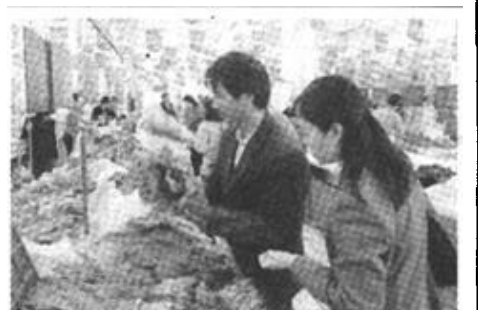
12月12日,市民在福州新改造的北大生鲜超市里选购蔬菜。福州市从2002年初开始全面推进“农贸市场超市化”的改造工作。由于超市经营的农副产品价格相对较低,且购物环境好,深受消费者欢迎。

加强计划用水等措施,保证城市居民生活用水需求,缺水严重城市应抓紧制定应急供水方案。通知强调,节约用水是我国尤其是北方地区解决干旱缺水的根本性措施。各地要采取综合措施,进一步加强节水力度。农业节水的重点是要加快灌区的节水改造和各种节水技术的推广应用,调整种植结构,提高水的有效利用率。各行各业都要实行用水定额管理,建立合理的水价形成机制。要强化水资源的统一管理,按照“先生活、后生产、先节水、后调水、先地表、后地下”的原则进行水量调度,科学配置。严重缺水地区在水量使用上要留有余地。黄河在确保不断流的同时,尽最大可能缓解全流域用水紧张局面。各地一定要把解决农村人畜饮水困难作为当前抗旱工作的重点,必要时组织发动社会力量为困难地区群众送水。要继续增加投入购置抗旱设备,提高抗旱机动能力,各级抗旱服务队要迅速行动起来,为农民抗旱排忧解难。通知还指出,各有关部门要顾全大局、密切配合,深入旱区,深入群众,了解掌握旱区实际需要,在做好本行业抗旱工作的同时,积极支持抗旱工作。